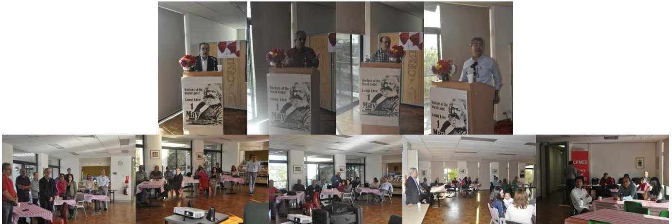
حزبی کۆمونیستی کریکاریی کوردستان/ریکخراوی دهرهوه ٣نایاری ٢٠١٧

بووه. له درێژهی قسهکانیدا جهختی کردهوه لهسه ئهم بارودۆخه‌ی که به‌رینی به‌ ته‌واوی خه‌لک گرتوه، پێویسته بزوتنه‌وهیهکی ناره‌زایه‌تی له دژی هه‌ژاری بێته‌مه‌یدان، که ته‌واوی کریکاران و فه‌رمانبه‌ران و قوتاییان و لاوان و ژنانی کوردستان و عیراق بۆی بینه‌ مه‌یدان. ته‌واوی مه‌رسمه‌که و له‌ نیوان قسه‌وباسی ئهم هاورێبانه‌دا چه‌نین گۆرانی و سروود و پارچه‌ شیعری جۆراوجۆر له‌سه‌ر کریکاران و خه‌بات و وه‌ستانه‌وه‌یان به‌رووی ئهم نيزامه‌ بۆگه‌نانه‌ی سه‌رمایه‌داریدا هه‌م خوێنرانوه و هه‌م له‌سه‌ر سه‌کرین پێشانی ئاماده‌بووان درا. بره‌گی دووه‌می مه‌راسیمه‌که به‌ پشوویهک و پاشان ئاماده‌بووان به‌شداریان کرد له‌ ریزگرتن له‌ رۆژه به‌ شادی و هه‌له‌په‌رکی. بۆی یه‌کی نایار رۆژی یه‌کیتی و هه‌وێستی چینی کریکار