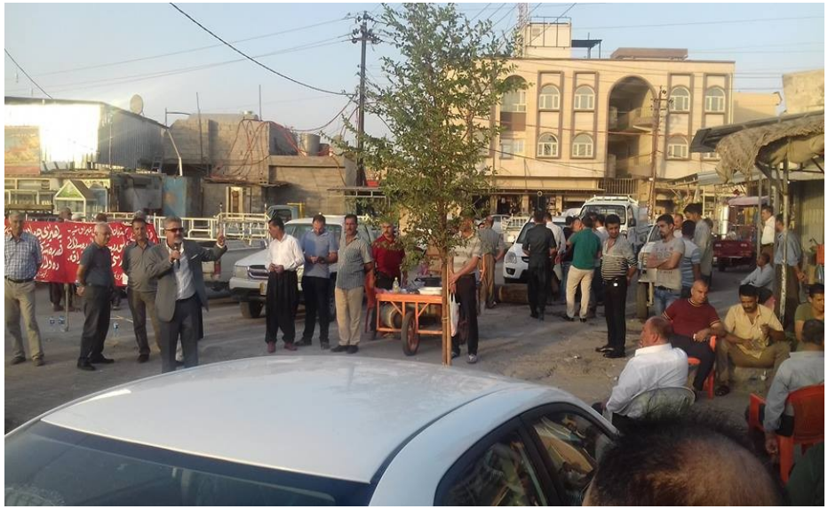
بۆ لاپەرە 5