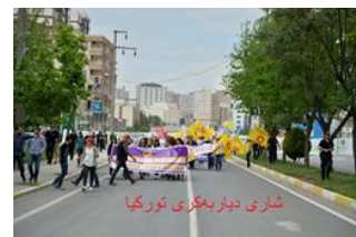
شاری دیاربه‌گزی تورکیا