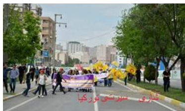
شاری سیرتسی تورکیا