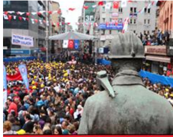
شارى زنگولداخی تورکیا