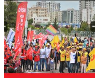
شارى ماردينى تورکیا