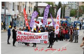
شاری سیلتسی تورکیا