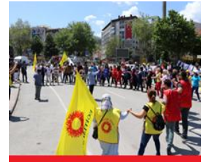
شارى کوتاهایى تورکیا