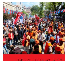
شارى تمبرابزونى تورکیا