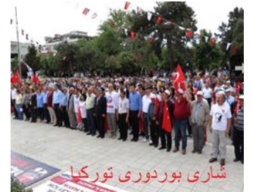
شارى بوردورى تورکیا