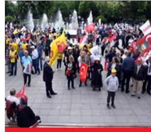
شارى قهیسهرى تورکیا