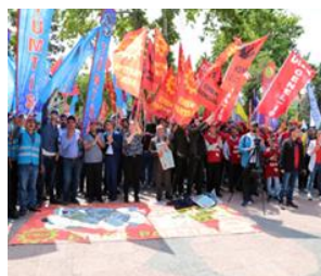
شارى گازی نمنتابى تورکیا