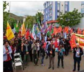
شارى تونجملی تورکیا