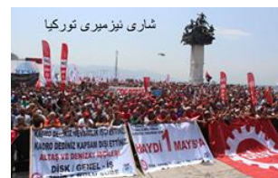
شاری نزمیری تورکیا