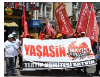
شاری نارنقینی تورکیا