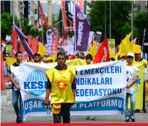
شارى وشاکی تورکیا