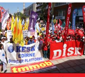
شارى نهدیرنهى تورکیا