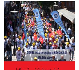
شارى بارتینی تورکیا