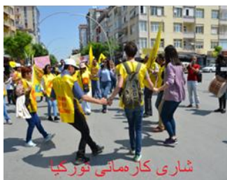
شاری کاره‌مانی تورکیا