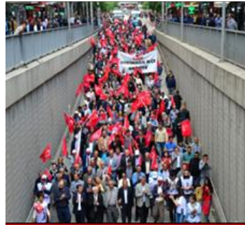
شارى مالاتیای تورکیا