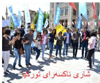
شاری ناکسه‌رای تورکیا