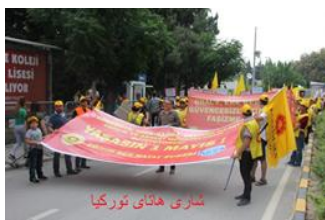
شاری هانی تورکیا