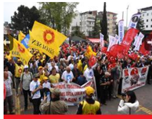
شارى نوردوی تورکیا