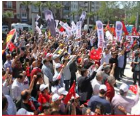
شارى چاناکالینى تورکیا