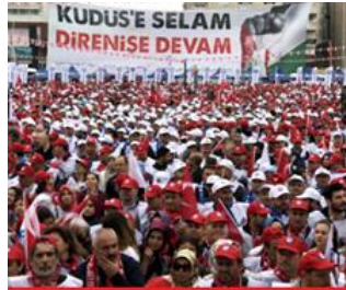
شارى کوجهیلی تورکیا