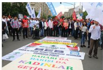
شاری باتمانی تورکیا