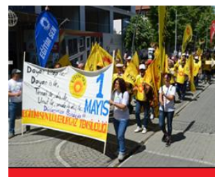
شارى کبرکمله لاری تورکیا