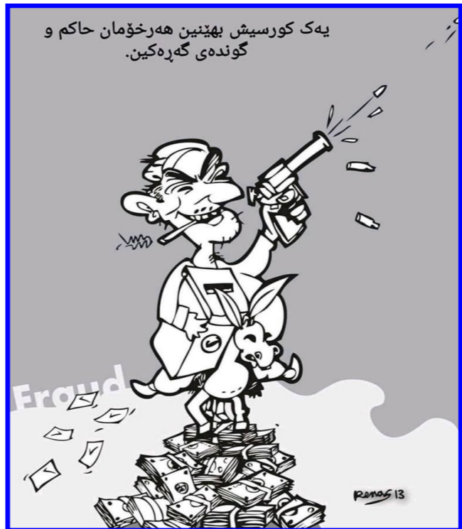
يهك كورسيش بهينين هه رخۆمان حاكم و گونده ي گه ره كين.

دهرگيرى ئاواره يى بون و كوردستانيان به جى هيشتوه به جى ده هيلن، به هه زاران ژن كوژران و چه ندين رۆژنامه نوس رفيندران و له ناويران، دي وه زمه ي دل ه راوكى و مه ترسى شه رو ده خاله تى ئيران و توركي و ئەمريكاو هيزه ئيسلاميه تيرورسته كان و گه رانه وه بۆ به غداد، ئەمانه و ده يان ديارده ي تر كه ژيانى نائارامى هاوالاتيان ده سه لمينن، به رده وام كابوس ي كه و كار ه سات به دواى كار ه سات ده خولقيني. ئايا يه كيتيه كه ي "قوبادو پا قئيل و جهنگى" سيا سه ته ي يه كيتيان گو رپوه و په شيمانن له 16 ئو كتۆ به ر و رودا وه كانى 27 فر سه تى كار له گيژاوى بازاردا چه قيو وه سپيردرا وه به رحه مه تى به رپرس و ئينتماي حزبى و هيج ئاسۆيه كيش بۆ دامه زراندى گه نجان و ده رچوانى زانكو وه ر هاوالاتيه كى ئاماده به كار رون نييه و سالانه ش له شكرى بيكارى به ره و سه ره وه ده روات. ئەم به جيا له وهى كه هيج قسه به ك بۆ دانى بيمه ي بيكارىو بيمه كۆمه لايه تيه كانى تر له ئارادا نييه. ئايا له دؤخيكى ئاوادا چۆن ده توان هه لى كار بره خسين؟ ئايا بريا رتاند اوه ده ست له سه رمايه و داها ته قورخكرا وه كان هه لگرن و پار ه پولى دزرا و