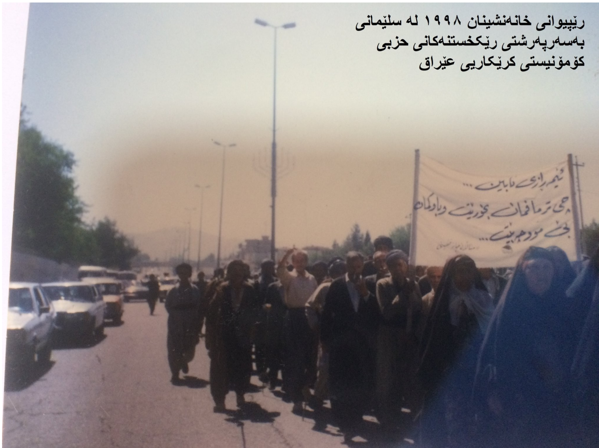
رێپێوانی خانه نشینان ۱۹۹۸ له سلیمانی به سه ره پهر شتی ریکهسته کانی حزبی کۆمۆنیستی کرێکاری عێراق