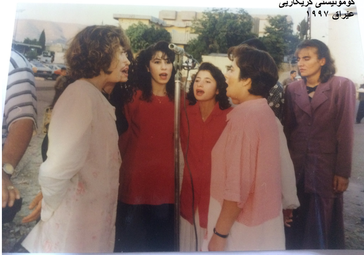
سائیادی دامەزراندنی حزب ١٩٩٧

یادی دامەزراندنی حزب کۆمۆنیستی کرێکاریی عێراق ١٩٩٧