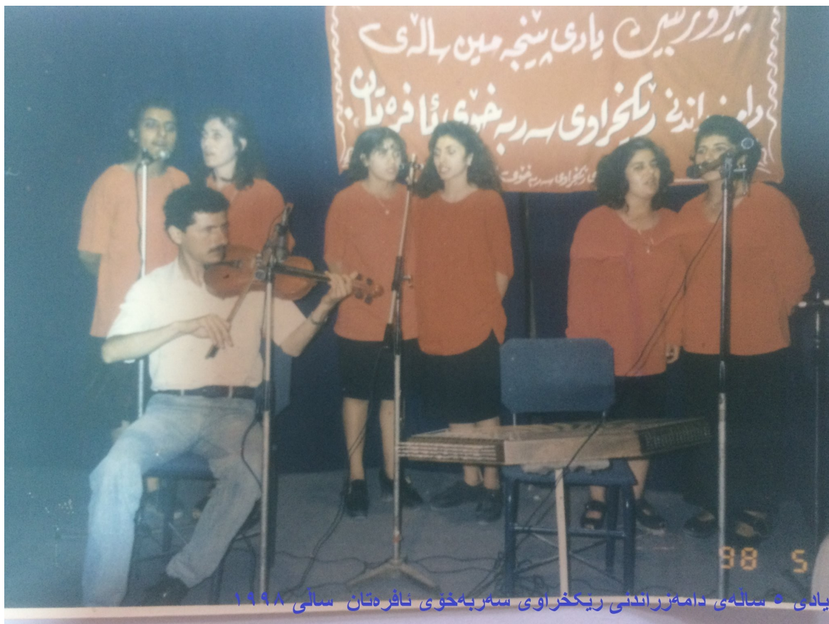
یادی ٥ ساڵەیی دامەزراندنی ریکخراوی سەربەخۆی ئاfrهتەن ساڵی ١٩٩٨