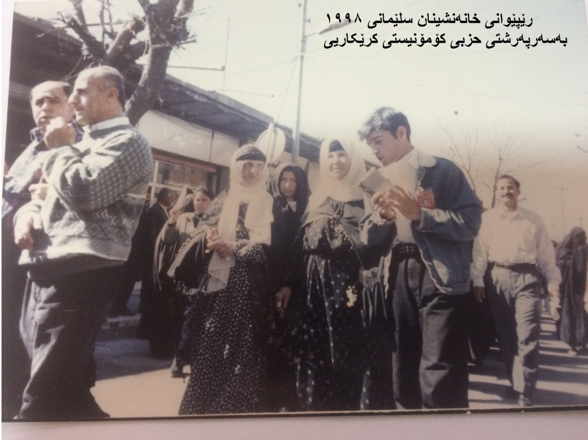
رێپێوانی خانه نشینان سلیمانی ۱۹۹۸ به سه ره پهر شتی حزبی کۆمۆنیستی کرێکاری