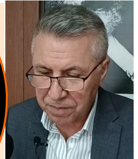
موحسین که ربه

روژی دووشه ممه 22 ی نیسان ره جبه ته یب نۆردوگان سهردانی به غدای کردو له گه ل به رپرسیانی عیراق کۆبووه وه. دواتریش سهردانی هه ولێری کردو چاوی به سه رۆکی پارتی و به رپرسیانی هه ریم که وت.